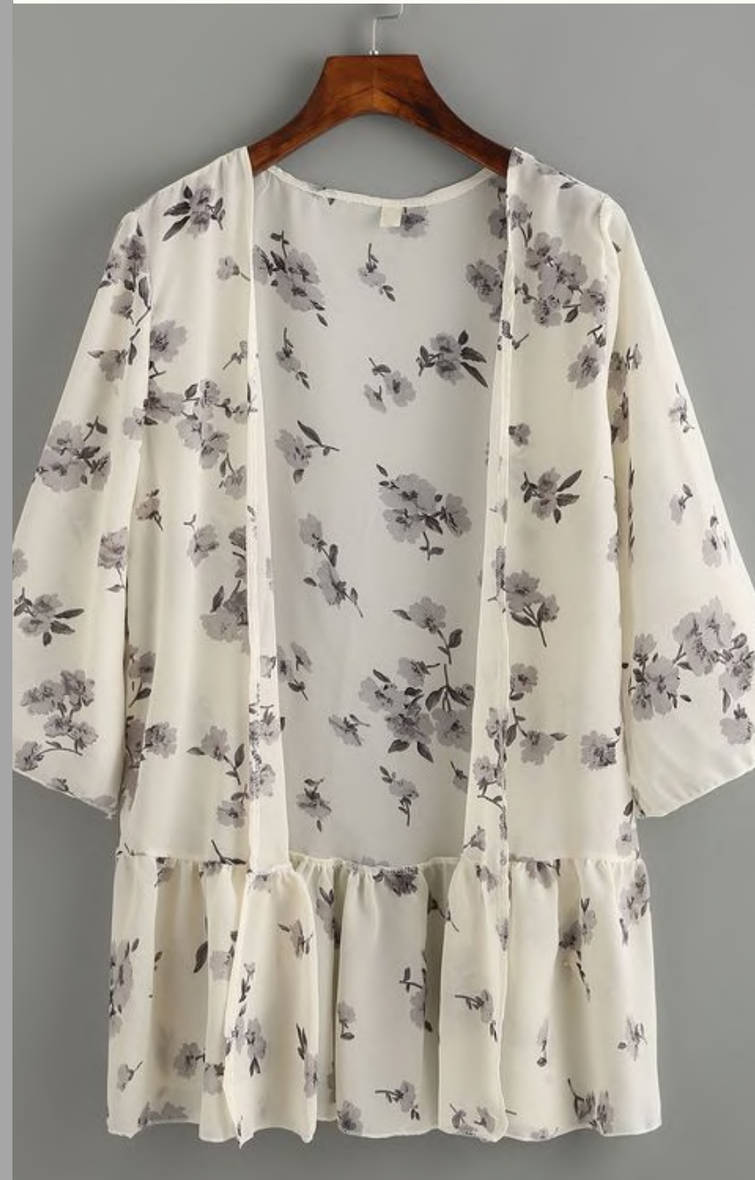
Kimonos tecidos fluidos